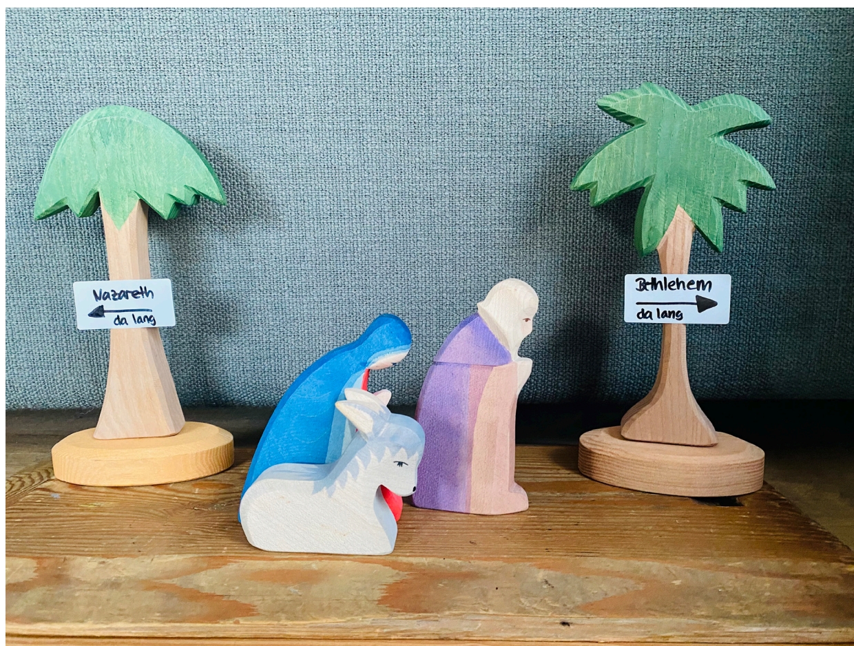
Isabella und Louisa